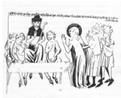
Przed sądem Jadwiga broni wdowy i sieroty.