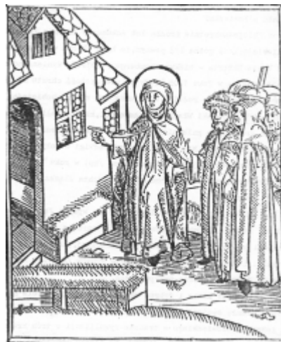
Jadwiga udziela schronienia bezdomnym w zadbanym domu