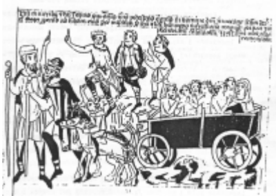
Pielgrzymi udający się do grobu św. Jadwigi