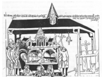
Pielgrzymi u grobu św. Jadwigi