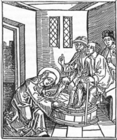
Jadwiga myje i całuje stopy trędowatych