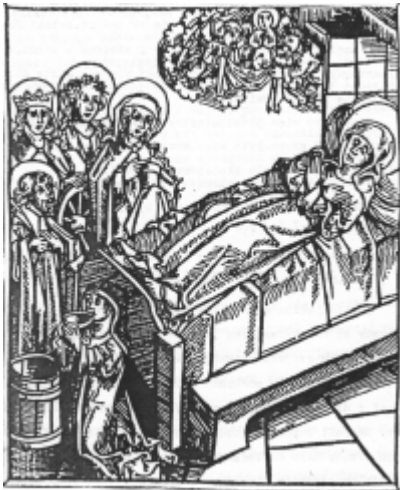
Przy śmierci Jadwigi obecne są święte, które jej się wcześniej ukazały. Klęcząca mniszka z naczyniem znamionuje jej cudowne uleczenie od wiecznego pragnienia