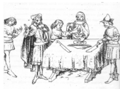
Henryk użalał się na Jadwigę, że zamiast wina pije wodę Jadwiga przemienia więc wodę w wino