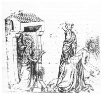
Jadwiga sama biczuje się do krwi i nakazuje by ją biczowano