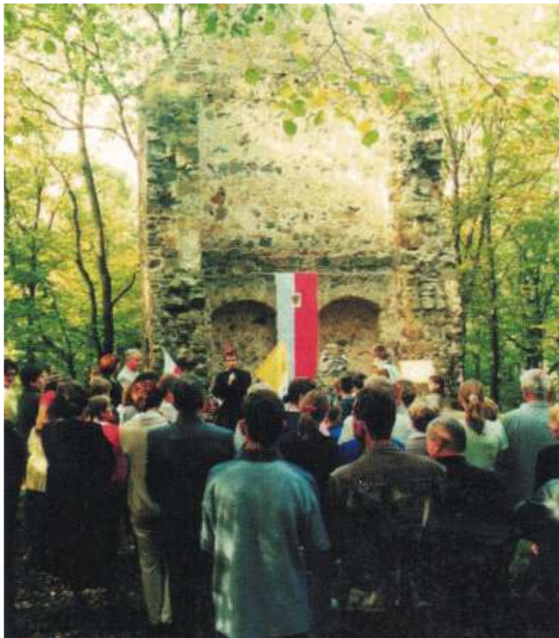
Uroczyste otwarcie ścieżki św. Jadwigi 14 X 2001, na Wzgórzu Zamkowym.