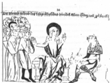
Jadwiga uwalnia biednych od podatków