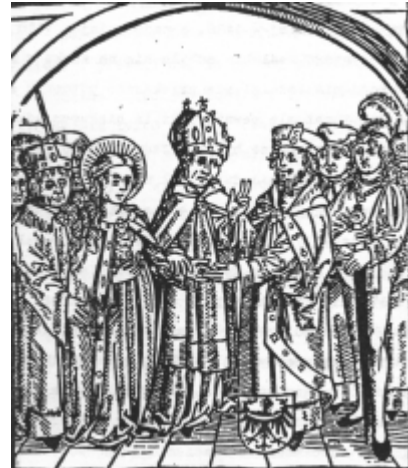
Ślub Jadwigi i Henryka I Brodatego.