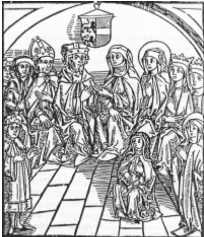
Rodzice i rodzeństwo Jadwigi oraz jej siostrzenica św. Elżbieta