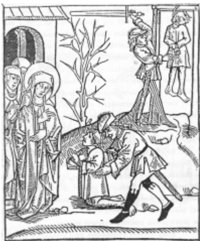
Jadwiga ratuje skazanego na śmierć oraz wisielca