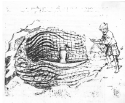
W dniu kanonizacji Jadwigi, w Viterbo wyłowiono ryby w jeziorze, w którym dotąd ryb nie było