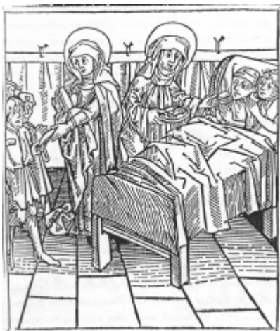
Jadwiga daje chleb głodnym, a chorym lekarstwo